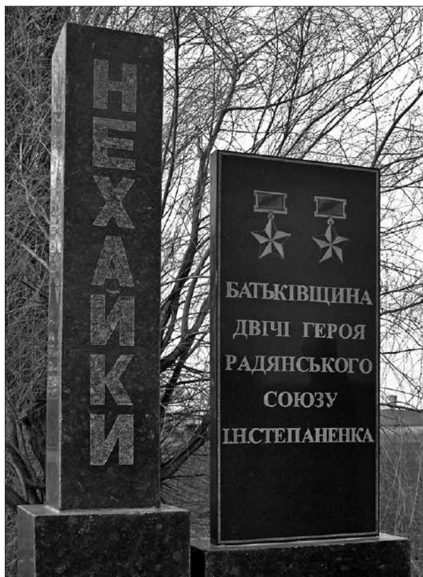
Пам'ятна стела на в'їзді до села Нехайки – малої батьківщини Івана Степаненка. Село Нехайки, квітень 2014 р.

серед тридцяти найрезультативніших асів Антигітлерівської коаліції п'ять українців, три американці, один британець та один – південноафриканець. (див. таб. № 1).