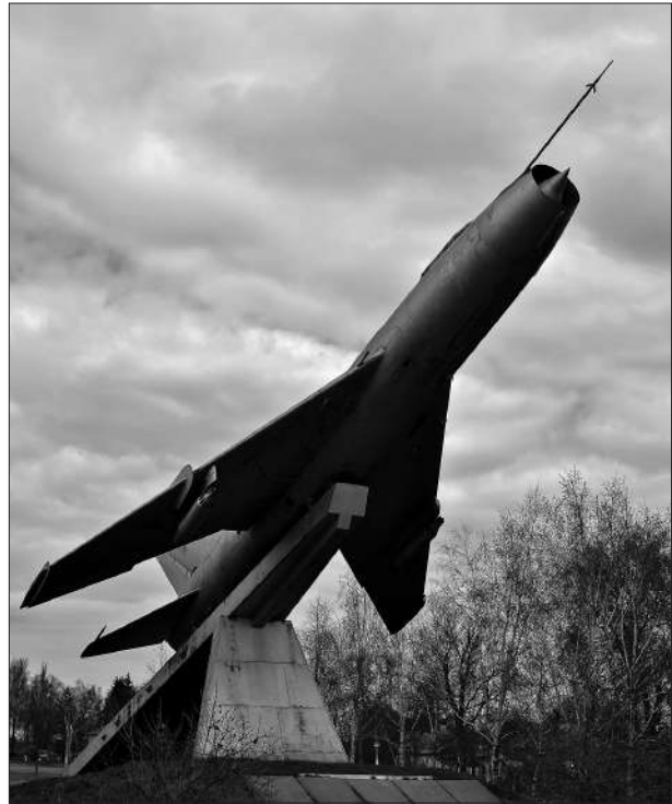
Монумент на честь Івана Степаненка та авіаторів - вихідців із села Нехайки. Квітень 2014 р.

І. Н. Степаненко увійшов до групи асів винищувальної авіації, удостоєних двічі та тричі звання Героя Радянського Союзу (всього 27 осіб). Саме ця група льотчиків складала три відсотки від загальної кількості повітряних бійців, які під час бойових дій збили 1044 літаки противника, що в свою чергу склало третину літаків противника, знешкоджених асами ВПС