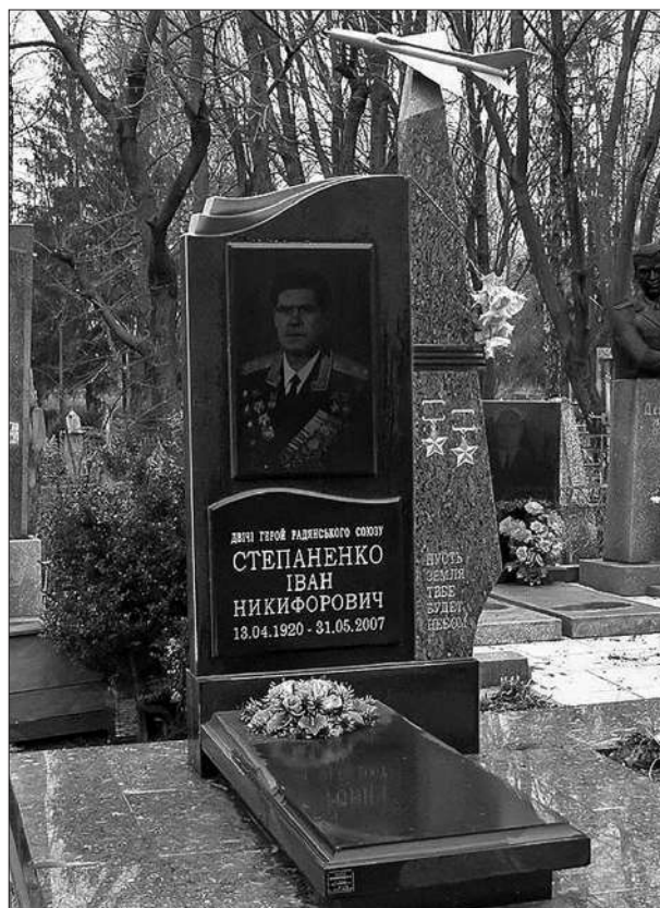
Могила льотчика. Черкаси, квітень 2014 р.

Після закінчення війни І. Н. Степаненко продовжив службу в авіації. Певний час він командував своєю ескадрильєю. Літав на винищувачах Як-3, Як-11. Згодом почав опановувати і реактивну техніку. 10 лютого 1947 р. Іван Степаненко отримує направлення до Військової академії імені М. В. Фрунзе, яку успішно закінчує 26 листопада 1949 р. Згодом він отримує звання підполковника і призначення на посаду заступника командира полку. Згодом І. Н. Степаненка призначають командиром одного з винищувальних авіа-