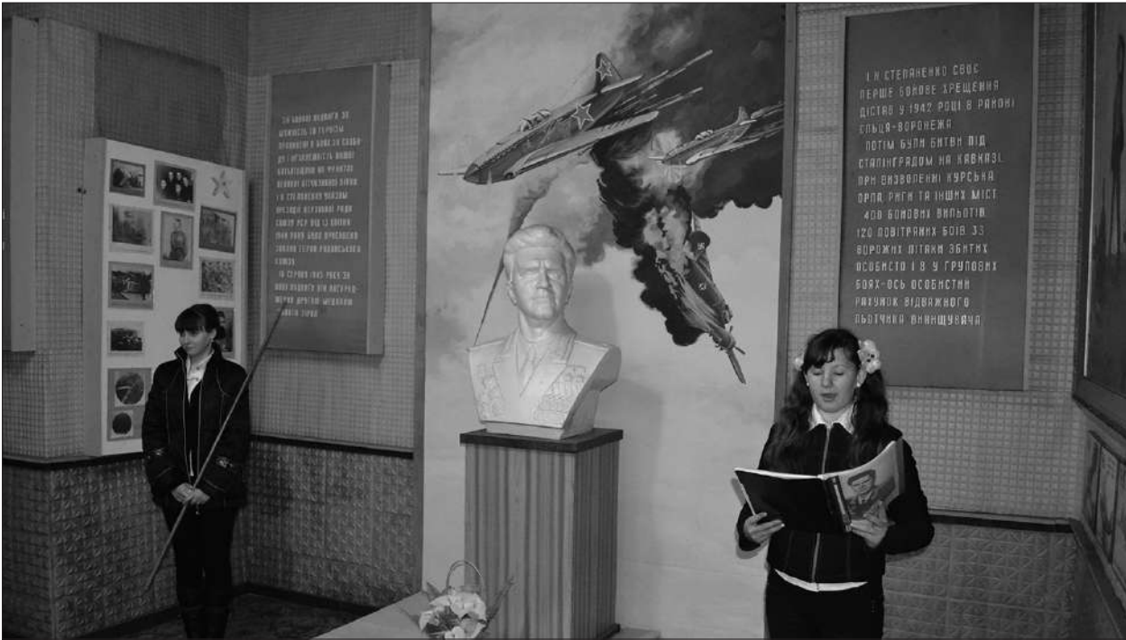
Юні мешканці села Нехайки проводять екскурсію, присвячену Івану Степаненку. Кразнавчій музей. Квітень 2014 р.

сил. Коли підправився, почав ходити самостійно їсти, але щодня приносив скибочку хліба сестрі. Так діти і врятувалися від смерті” [1, с. 295, 296].