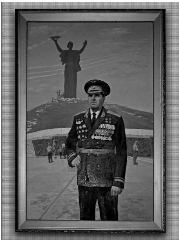
Портрет льотчика. Експозиція краєзнавчого музею с. Нехайки.

Мурманська до міста Кинешма Іванівської області нову матеріальну частину – британський одномісний винищувач Гоукер Гаррікейн. До Мурманська на транспортних літаках відправляються льотчики і техніки 4-го ВАПу.