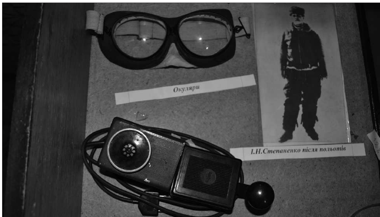
Особисті речі і фото льотчика. Експозиція краєзнавчого музею с. Нехайки.

стругувати букси для залізничних вагонів. Кожна з них мала вагу близько 46 кілограмів. Готував їх до “тонких” слюсарних робіт: просвердлював дірки для дверцят, на стругальному верстаті простругував зверху й знизу, обробляв горловину. Операція закінчувалась навантаженням на візок і відправкою до іншого цеху” [6, с. 9].