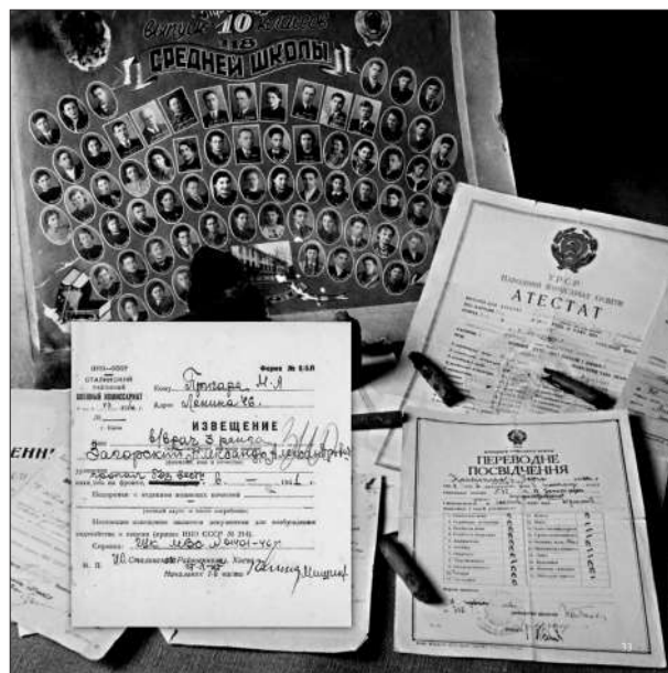
Матеріали експозиції Національного музею історії України у Другій світовій війні.

лізації та комплектування армії. У наказі стосовно цього йшлося про те, що метою є “покращення організаційної роботи з обліку персональних втрат на фронтах та найбільшого узгодження її із загальною роботою щодо мобілізації та укомплектування армії” [17, 123].