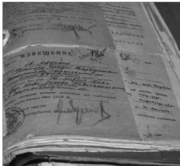
Книга реєстрації сповіщень про загибель військовослужбовців

зниклих безвісти й померлих від ран почали складати лише в січні 1942 р. Склад командирів, а іноді й особовий склад цілих рот за цей час був оновлений повністю. Результатом згаяного часу стала складність, а часом і неможливість відновити реальний стан речей від початку війни [...]. Особливо незадовільно облік утрат вівся у 18-му гвардійському стрілецькому полку. За час боїв від листопада 1941 р. до квітня 1942 р. полк утратив 6 245 осіб, зокрема безповоротно – 2 019 осіб. Іменні списки були надіслані лише на 1 727 осіб. Про загибель 292 бійців не було повідомлено через відсутність прізвищ” [21]. Працівники Центрального бюро виявили, що в полку значився загиблим червоноармієць М.А. Яковлев, засуджений за дезертирство. Установити, за яких обставин сталася втеча М.А. Яковлева і чому він потрапив до списків убитих, виявилось неможливим через загибель усіх військовослужбовців 5-ї роти, де воював солдат, і всіх командирів