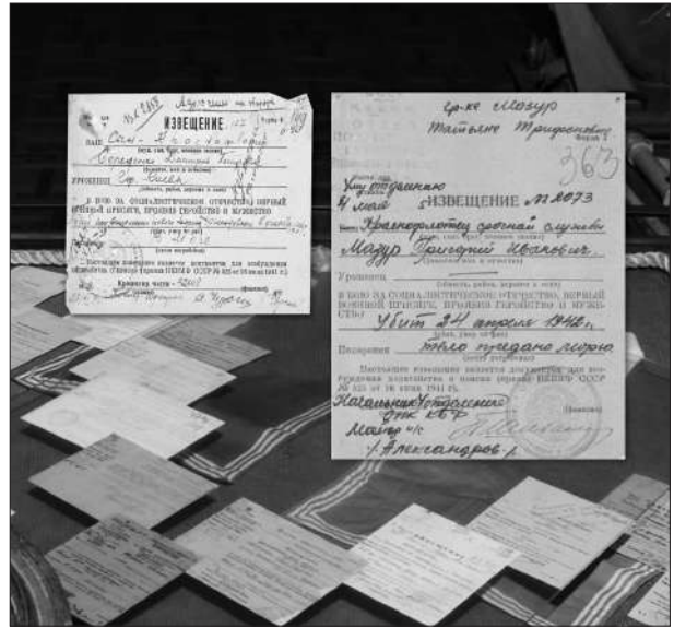
Матеріали експозиції Національного музею історії України у Другій світовій війні.

Виклад основного матеріалу. 95,2 % українців та уродженців УРСР, які зі зброєю в руках боролися проти нацизму в 1941–1945 рр., воювали в лавах РСЧА 1 . Вони брали участь у боях на німецько-радянському фронті й у розгромі Японської імператорської армії. Скільки з них загинуло – це питання довгий час узагалі не поставало, оскільки в СРСР військових і цивільних, уродженців різних республік, рахували як загальносоюзні втрати. Офіційна цифра залежала від політичної та ідеологічної кон'юнктури. Так, уперше про 7 млн жертв Й. Сталін повідомив у інтерв'ю кореспонденту “Правди”, наданому з нагоди промови В. Черчилля у Фултоні; про 20 млн загиблих радянські громадяни довідалися з відкритого листа М. Хрущова прем'єр-міністрові Швеції Т. Ерландеру в 1961 р. До 45-ї