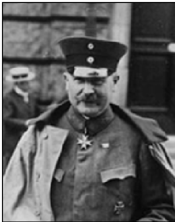
Фото 3. Генерал Вільгельм Гренер

мецького генерала В. Гренера (фото 3) П. Скоропадському: “Навіщо Вам армія? Ми знаходимось тут, нічого противного Вашому уряду всередині країни ми не дозволимо, а стосовно Ваших північних кордонів Ви можете бути цілком спокійні: ми не допустимо більшовиків. Створіть собі невеликий загін у дві тисячі чоловік для підтримки порядку в Києві і для охорони Вас особисто” [10, с.179]. У своїх спогадах П. Скоропадський наводить відомості про підступні, та фактично антиукраїнські дії австрійського майора Флейшмана, який у перші дні його гетьманства запропонував провести переговори з начальником січовиків Є. Коновальцем, з метою переконати їх підпорядкуватись новій владі. У той же час, за свідченням гетьманської розвідки, майор Флейшман налаштовував січовиків проти гетьмана. Внаслідок чого П. Скоропадський був змушений січовиків роззброїти та розформувати [10, с.172]. Отже, і без того слабка, Українська держава втратила ту військову підтримку патріотично налаштованого військового підрозділу, який міг їй надати.