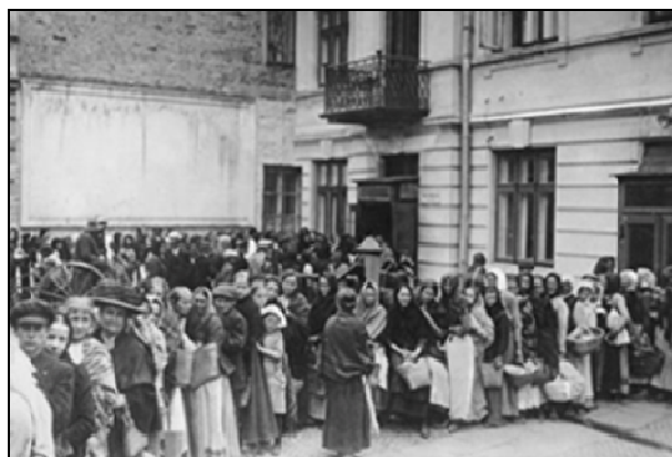
Фото 2. Черга за хлібом. Берлін під час Першої світової війни

У подальшому за ініціативою великих землевласників були створені карні відділи, що разом з появою всяких грабіжницьких елементів лише поглиблювало загальнодержавну кризу в Україні, формувало негативну думку про українську владу, виховувало почуття недовіри й озлобленості. “Багато було вбивств, мордування, грабунку, багато, значить, накопичилось злоби й жадоби помсти” [3, с.327].