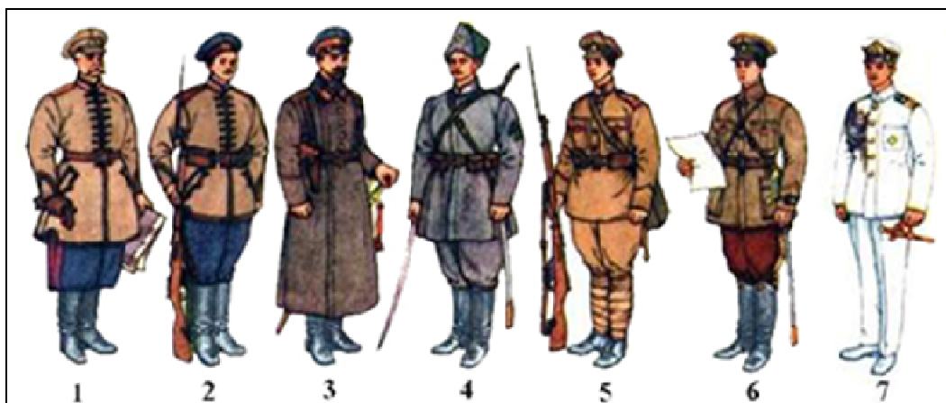
Рис. 1. Збройні сили Української Держави (Гетьманату):

ної структури з впливу на народні маси. Зокрема, було засновано Державне та ряд приватних видавництв, які видрукували понад 70 назв українських книжок в мільйонах примірників” [7, с.13].