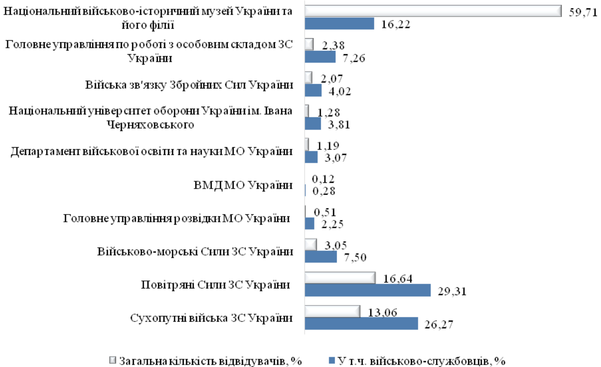
Рис. 3. Загальна кількість відвідувачів військових музеїв (музейних утворень) ЗС України станом на 31.12.2012 року, %*

* Джерело: сформовано автором на основі [1 (2012, 2013)].