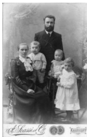
Фото 3. Сім'я Оконеvських. Фото 1903 р.