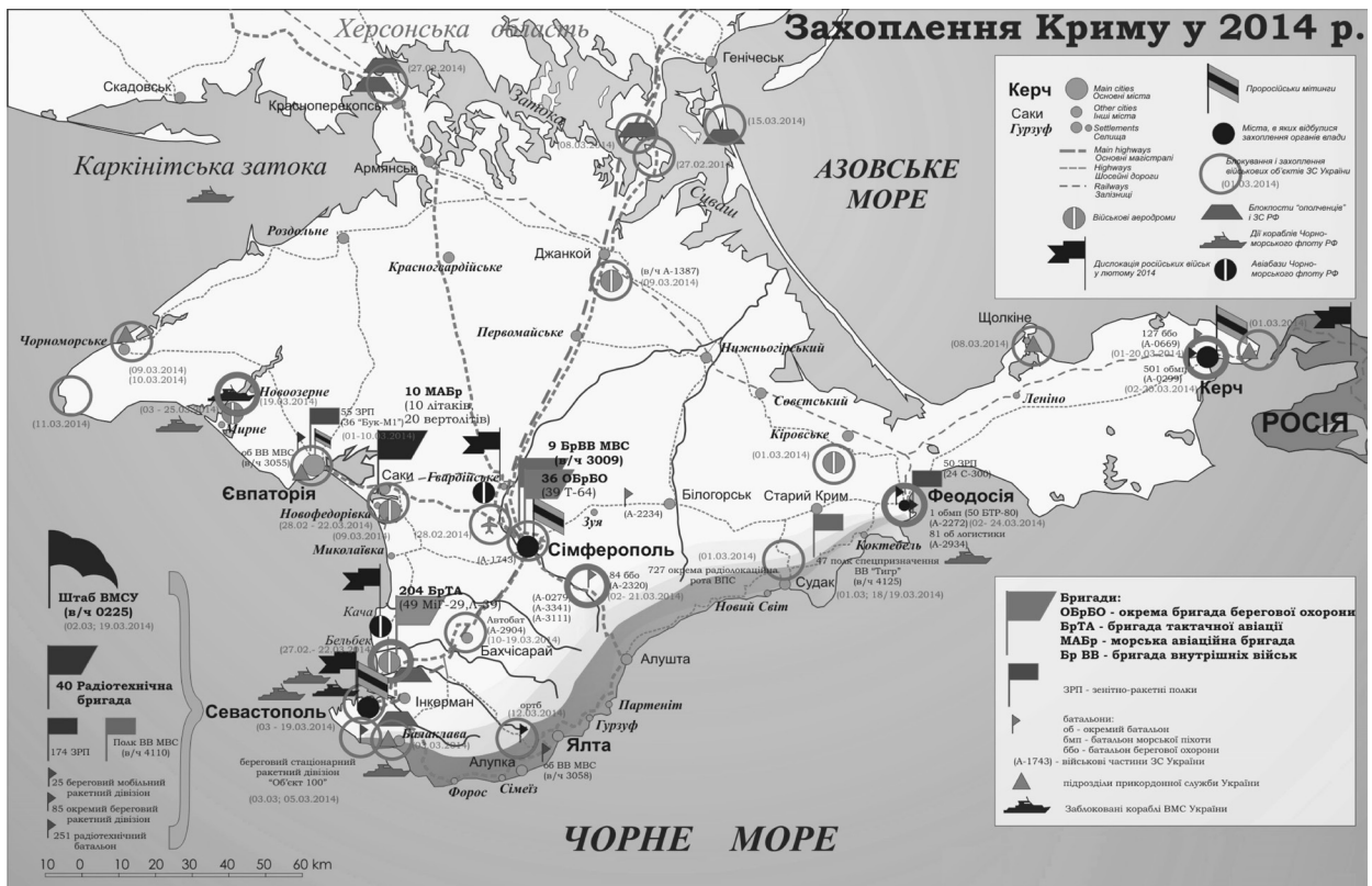
Рис. 2. Блокування і захоплення військових об'єктів у Криму, 2014 рік.