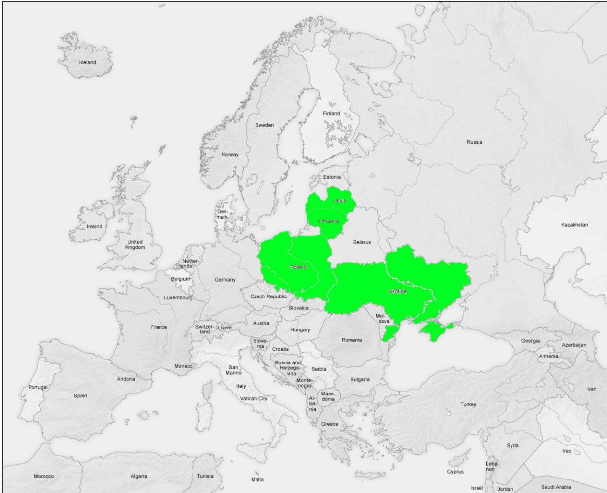
Рис. 2. Висвітлення територіального пріоритету у разі об'єднання Україна-Польща-Литва-Латвія

Створення Балто-Чорноморського союзу — геополітичної вісі, проекту, що не суперечить засадам ЄС та НАТО, а навпаки лише їх доповнює, по-перше створить потужний безпековий пояс між Європою та Росією і захистить країни, які мають спільні з агресором кордони, по-друге, сформує потужний військово-політичний блок (Волович, О. 2016а, 2016б).