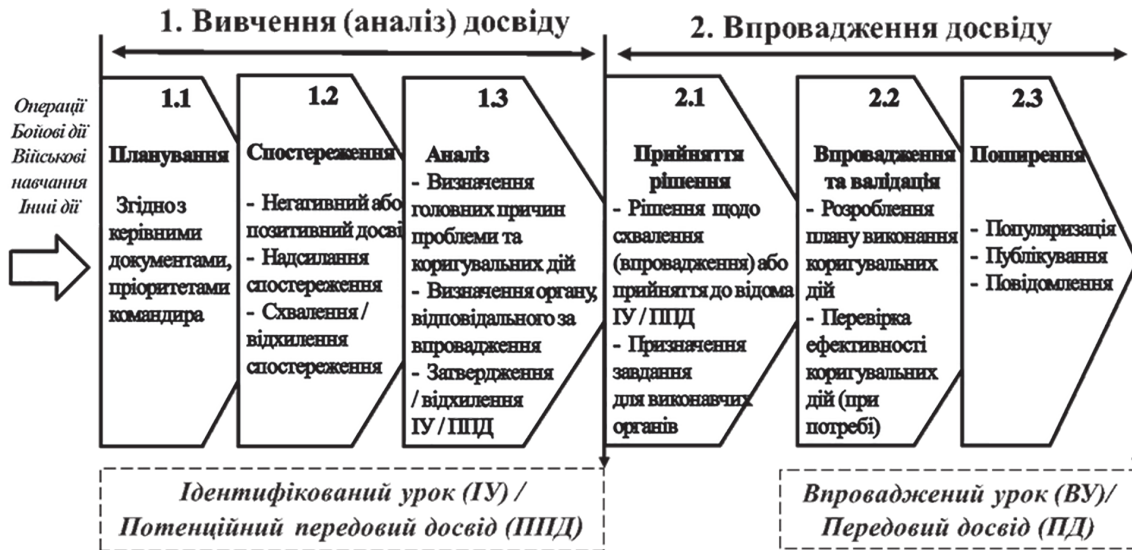
Рис. 1 Стандартизований процес ВВД НАТО

Дана стаття зосереджується на аналізі чотирьох важливих аспектів, що залишаються без належної уваги українських науковців із питань реформування ЗС України: реагування ОВВД ЗС України на розв’язання росією повномасштабної війни проти України; головні зміни, що відбулися у функціонуванні СВВД в умовах війни; переваги та недоліки поточної Системи вивчення і впровадження досвіду; шляхи її удосконалення.