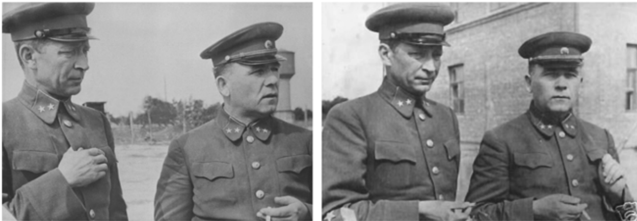
Рис. 4. Фото полонених генералів П. Г. Понеделіна та М. К. Кирилова, опубліковані в австрійській газеті «Tages-Post» (ліворуч) та в угорській газеті «Oedenburger Zeitung» (праворуч)

Щойно у Німеччині стало відомо, що П. Г. Понеделін та М. К. Кирилов звинувачені у державній зраді (інформація про дію в СРСР наказу № 270 стала відомою для німецьких спецслужб після захоплення у полон низки високопоставлених радянських воєначальників у Київському і Вяземському котлах наприкінці вересня – на початку жовтня 1941 року), німецька розвідка почала схиляти генералів до співпраці, пропонуючи перейти на службу до Третього Райху (Лискин, Ю. А. 2010, с. 373, 375). Співробітники із т. зв. «Східного міністерства» тиснули на генералів, у тому числі й брудними методами, використовуючи їхні світлини, зроблені у серпні 1941 року.