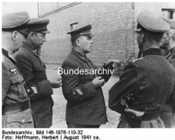
August 1941 ca.

У нашому випадку це агенція «Presse-Illustrationen Heinrich Hoffmann», що належала Генріху Гофману — особистому фотографу Адольфа Гітлера. Агенція мала відділення у Берліні та Відні. Ця установа купувала фото у військових кореспондентів, які служили у ротах пропаганди. Усі знімки обов'язково штампувалися на зворотному боці, там же вказувався номер, назва фото (опис) та прізвище фотографа (рис. 3).