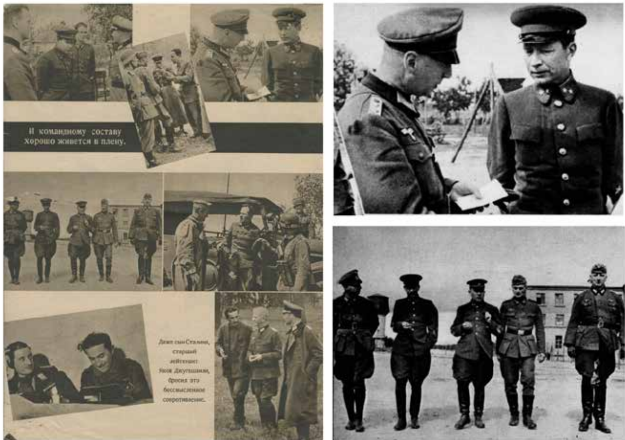
Рис. 6. Фото полонених генералів П. Г. Понедєліна та М. К. Кирилова на німецькій агітаційній листівці серії «РА» (Фрагменти листівки 190 RA, листопад 1941 р.)