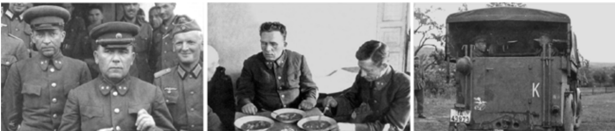
Рис. 2. Полонені генерали П. Г. Понеделін та М. К. Кирилов (ймовірно місце зйомки штаб 1-ї танкової групи, м. Новомиргород, 7–8 серпня 1941 р.)

х — на початку 1980-х років. На військово-історичних форумах й досі можна натрапити на повідомлення, що однією з причин розстрілу П. Г. Понеделіна стали німецькі фотографії, на яких зображений командарм, який нібито «підіймає келих шампанського» за перемогу Вермахту, і що це фото тиражувалося на німецьких листівках. На початку 2000-х років про це писав М. С. Ковальчук, який стверджував, що такі листівки буцімто були надруковані в Новоархангельську, де П. Г. Понеделін перебував у перші дні полону (Ковальчук, М. С. 2006, с. 92). Де-хто стверджував, що такі листівки бачив сам Й. В. Сталін і що саме вони викликали у «вождя» реакцію у вигляді наказу № 270. Але у межах порушеної проблеми дослідники й досі шукають такі фотознімки і листівки. Інтерес до цього посилюється з публікацією науково-популярного видання «Німецькі танки в Україні, 1941 рік» авторства французького дослідника Ф. де Ланнуа, що з'явилася на пострадянському просторі у 2006 році, а у Західній Європі кількома роками раніше (Lannoy, F. de. 2001). У виданні було розміщено три фотознімки (рис. 2), на яких зображено полонених генералів П. Г. Понеделіна та М. К. Кирилова (Ланнуа, Ф. де. 2006, с. 99).