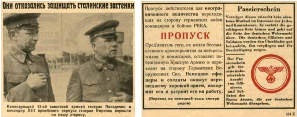
Рис. 5. Фото полонених П. Г. Понедєліна і М. К. Кирилова та купон-пропуск переходу на сторону німецьких військ командирів і бійців РСЧА з німецької газети-листівки (жовтень 1941 року)