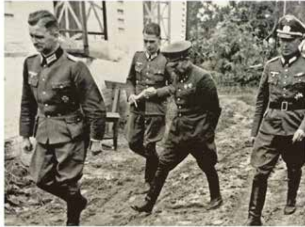
Рис. 8. Фото полоненого командарма з німецької агітаційної листівки, листопад 1941 р. та з німецькомовних газет « Bedener Zeitung » і « Volkszeitung (Kärnten) » (праворуч)

Представлені фотоматеріали є основою для додаткової постюридичної реабілітації П. Г. Понделіна та М. К. Кирилова, яких наказом Ставки ВГК № 270 було «призначено» головними винуватцями загибелі 6-ї і 12-ї армій. Разом із тим використані фотознімки є серйозним джерелом для оновлення юридичних та воєнно-історичних оцінок щодо ролі П. Г. Понделіна, М. К. Кири-