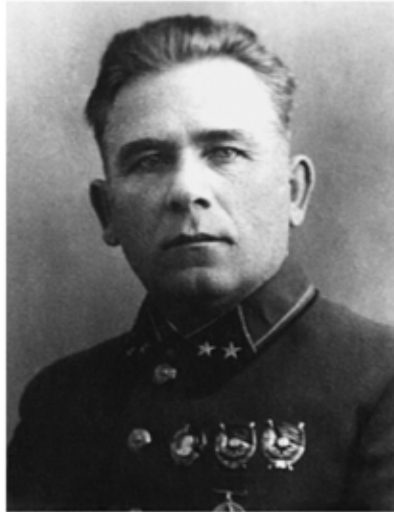
П. Г. Понеделін