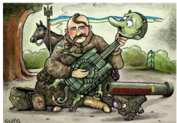
Рис. 5. Кустовський, О. (2023a). Козак Мамай — сила духу і незламність волі

На іншій карикатурі (Кустовський, О. 2023a) (рис. 5) автор зобразив Мамай у військовій формі, у традиційній позі, із люлькою. Поруч із ним лежить військовий шолом у камуфльованому чохла й армійська фляга з емблемою ЗС України. На задньому плані композицію доповнює дуб та кінь, припнутий жовто-блакитними поводками до древка списа із короговою тих же кольорів і наконечником у вигляді Тризуба. Корогви, як ві-