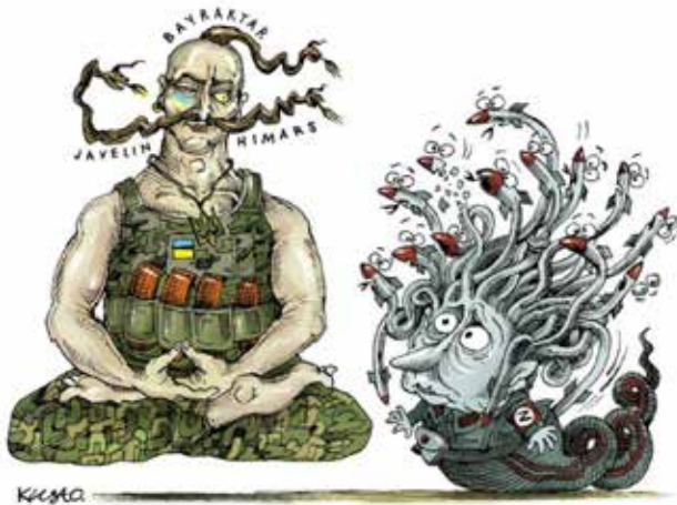
Рис. 4. Кустовський, О. (2023b). Козацьке дао

До асоціацій пози козака Мамай із далекосхідними релігійно-філософськими практиками вдається О. Кустовський і у карикатурі «Козацьке дао» (Кустовський, О. 2023b) (рис. 4). Тут Мамай сидить не просто по-турецьки, як на традиційних народних картинах, а радше у позі лотоса, характерній для індуїстсько-буддистських медитативних практик, зокрема техніки дзадзен. Асана передбачає положення сидячи зі схрещеними ногами, які знаходяться на протилежних стегнах. Руки складені у ритуальну космічну мудру (ліва долоня лежить на правій, пучки великих пальців стикаються; руки утворюють овал), що забезпечує людині концентрацію на розумінні власного призначення у світі, збалансовує життя, тренує внутрішній дух. Очі медитуючого залишаються напівприкритими, погляд під кутом сорок п'ять градусів спрямований поперед себе. Оскільки малюнок звертається і до терміна «дао», то зауважимо, що у даосизмі однією з головних цілей медитацій, зокрема цигун, є створення, перетворення і циркуляція життєвої енергії, здатної допомогти людині приймати виважені рішення. Філософсько-етична концепція Дао як «шляху людини» передбачає її моральний вибір і проходження власної долі.