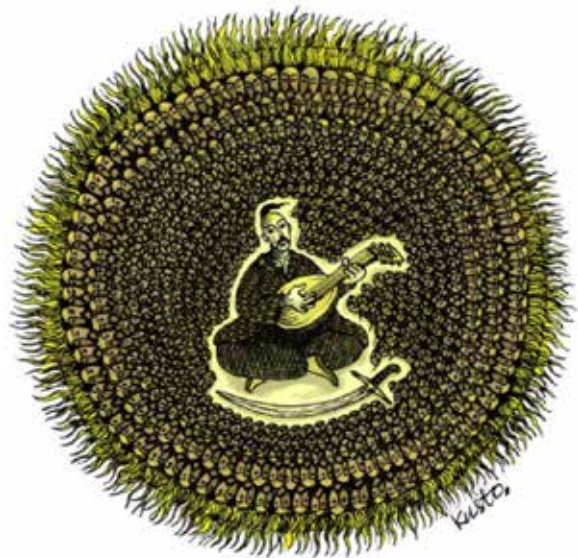
Рис. 3. Кустовський, О. (2022b). Без назви

козака з шаблею на боці, пишаллю на плечі і тризуб. У радянські часи соняшник часто фігурував у картинах представниць наївного мистецтва, зокрема Марії Приймаченко (1909–1997). Події літа 2014 року викристалізували усвідомлення соняшника як українського символу. По-перше, нідерландський борт «Боїнг-777» МН17 авіакомпанії Malaysia Airlines після збиття зенітним ракетним комплексом «Бук» російського виробництва впав у соняшникові поля поблизу Донецька. По-друге, сталася трагедія розстрілу російськими військами колони українських військових під Іловайськом, які виходили з оточення так званим зеленим коридором, що пролягав соняшниковими полями. Саме після подій в Іловайську ця рослина стала уособленням мужності українських військовослужбовців і офіційним символом Дня пам'яті захисників України, які загинули в боротьбі за незалежність, суверенітет і територіальну цілісність України (Клочко, Д. 2023). Тому використання його на карикатурі О. Кустовського не випадкове, до того ж головні формування українського козацтва розташовувалися у традиційних регіонах вирощування соняшників.