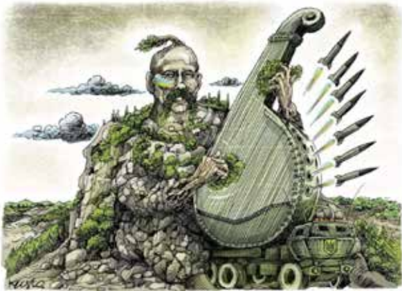
Рис. 2. Кустовський, О. (2022а). Без назви

Бандура сучасного Мамаєя стоїть на пусковій установці високомобільної ракетної системи залпового вогню M142 HIMARS, здатної використовувати весь спектр ракет боєприпасів MLRS, у тому числі оперативно-тактичні балістичні ракети типу ATACMS. На кабіні вантажівки на колісному ході — Державний Герб України. Потужні ракети вилітають із отворів в обичайці бандури, залишаючи за собою жовто-блакитний дим від палива. Таким чином, О. Кустовський поєднує постать козака Мамаєя і військовослужбовця ЗС України в один образ.