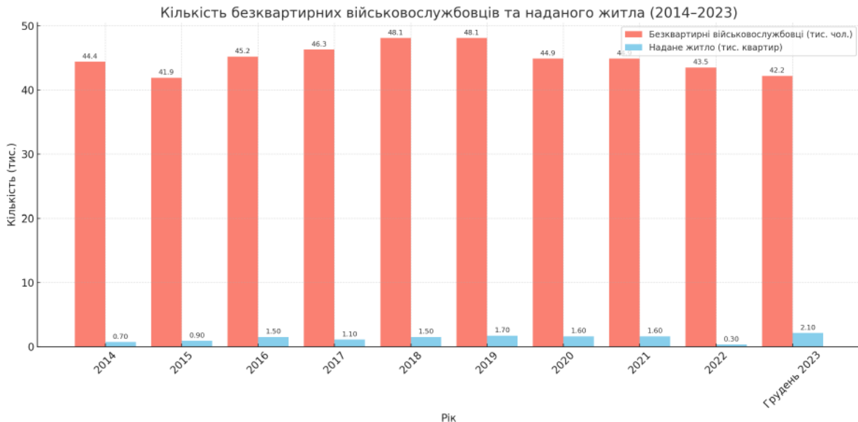
Рис. 3. Кількість безквартирних військовослужбовців та кількість збудованих/придбаних квартир (2014–2023 рр.)